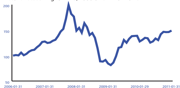
Historisk utveckling för Kina, 2006-01-31 - 2011-01-31*

Kina har 1,3 miljarder invånare och är det mest befolkningsrika landet i världen. Förutom enorma utländska direktinvesteringar och en hög produktivitet, anses landets ekonomi bli allt mer självständig från den internationella konjunkturutvecklingen tack vare sin starka inhemska marknad. Nyligen översteg den genomsnittliga löneinkomsten i Kina 7000 dollar vilket många anser vara en viktig milstolpe ur ett ekonomiskt utvecklingsperspektiv. I samband med stigande inkomster brukar den inhemska ekonomiska potentialen växa i form av nya konsumtionsmönster och utökad tjänstesektor. Under 2011 förutspås den kinesiska ekonomin att växa med cirka 9,6 %, detta trots ett starkt inflationstryck samt yttre påtryckningar från andra länder som t.ex. USA att appreciera sin valuta. Hittills har den kinesiska staten lyckats väl med att balansera dessa hot för att säkra en långsiktig hållbar ekonomisk utveckling.