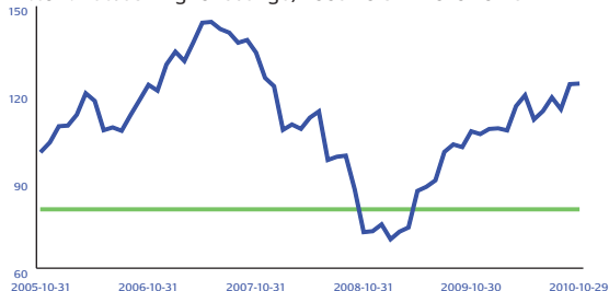
Historisk utveckling för Sverige, 2005-10-31 - 2010-10-29*

Den gröna linjen visar kupongbarriären och riskbarriären för Sverige, linjen är baserad på stängningsvärdet från 2010-10-29