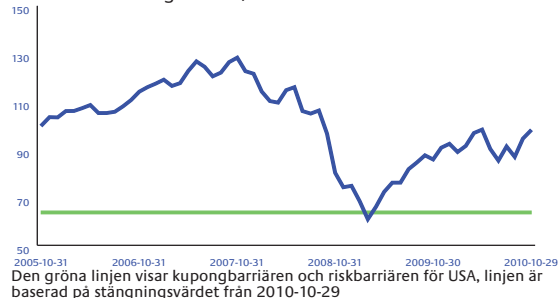
Historisk utveckling för USA, 2005-10-31 - 2010-10-29*

Den gröna linjen visar kupongbarriären och riskbarriären för USA, linjen är baserad på stängningsvärdet från 2010-10-29