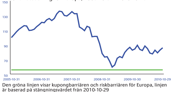
Historisk utveckling för Europa, 2005-10-31 - 2010-10-29*

Trots att den europeiska marknaden drabbats av en signifikant turbulens på senare tid till följd av skuldskrisen, har regionen i helhet erfarit den snabbaste tillväxten på fyra år under det andra kvartalet av 2010. Denna starka tillväxt har drivits på av den tyska ekonomin som går på högvarv tack vare en stark exportefterfrågan och en stark återhämtning i den inhemska byggsektorn. Framtidsutsikten för Europa ser relativt positiv ut tack vare statliga stimulanser, ett lågt ränteläge och en lågt värderad euro. Dock är riskerna fortfarande betydande då flera länder inom regionen har en ansträngd budgetsituation som kan påverka återhämtningen.